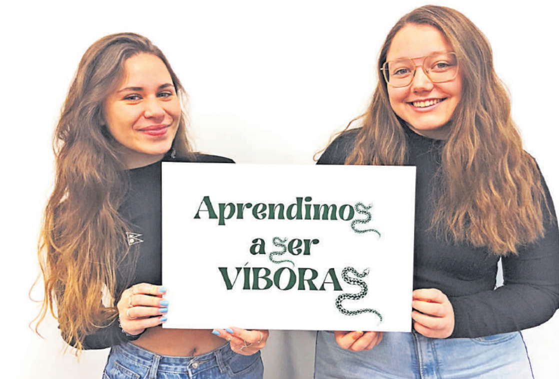
Fotografía de la exposición Multimedia Animaladas Feministas.